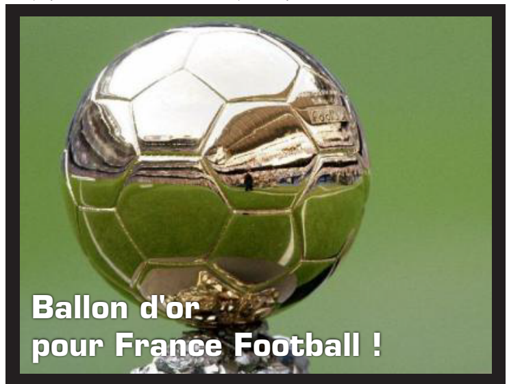
Ballon d'or pour France Football !

En temps normal et logique, je ne lis jamais France Football ou je n'écoute jamais la radio parlant de ce spot. Pour moi, le foot n'est qu'un sport de médias. En fait, pour nuancer mes propos, je trouve que ce sport est devenu le nid des riches et des magouilles en tous genres... mais j'y reviendrai. J'ai entendu, il y a peu, une publicité démentielle à tous les points de vue. Un présentateur parlait ainsi "ouiii, pognon qui passe à fric, qui dribble flouse, puis blé et caillasse... mais tacle de biffeton qui passe à oseille...". Dément. Nommer les footballeurs par des synonymes d'argent. Il fallait oser et finir la pub' par un magnifique "France Football, le seul journal qui parle vraiment du foot", c'est magique. C'est cette forme qui manque cruellement aux pubeux, de la satire que diable ! Merci à ce magazine pour cette pub' radio, si vous savez où je peux la trouver sur le Net, je suis preneur !